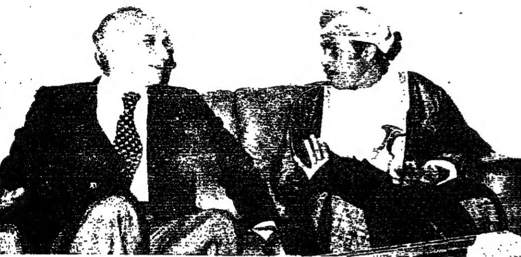
سعادة الاستاذ عبد العزيز الرواس في استقبال وكيل وزارة الاعلام الايراني